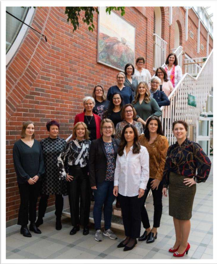
Den nyvalda förbundsstyrelsen vid kongressen i Borlänge.

Under våren ägnade styrelsen mycket tid åt arbetet med att ta fram förslag till nytt politiskt program för S-kvinnor. Alla ledamöter deltog aktivt i arbete med att skriva texter och flertalet deltog också i digitala hearings om programmet. Efter att förslaget gått på remiss till klubbar och distrikt arbetade förbundsstyrelsen om texterna utifrån inkomna förslag. Förbundsstyrelsen lade fram förslaget till nytt politiskt program till kongressen, där det behandlades och antogs.