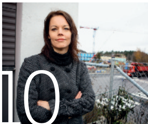
10 Veronica om framtidens bostäder

Socialdemokraternas 37e ordinarie kongress ska hållas den 3-7 april 2013 i Göteborg. I Morgonbris svarar partisekreteraren och partiordföranden på hur de ser på S-kvinnors hjärtefrågor i det nya partiprogrammet.