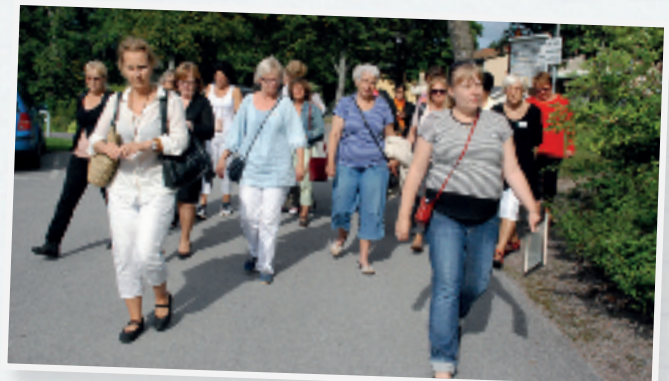
Hela kursgänget laddade med nya kunskaper för att förändra världen.

Eller en viktigare fråga: vilken värld vill vi se och hur kommer vi dit? Är vapenexport och den ekonomiska profiten vägen dit? Att alla ställer sig upp och sjunger »I natt jag drömde« känns mer än passande som avslutning på den här fantastiska kursen. ✿