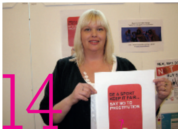
14 Anna kämpar mot människohandeln