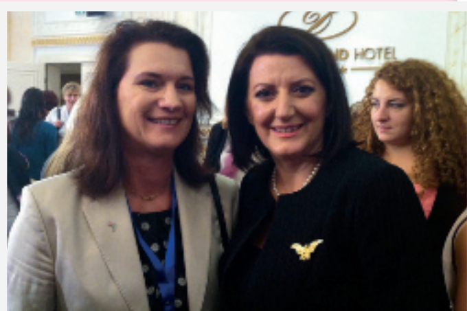
Ann Linde och Kosovos president Atifete Jahjaga. Hon är den första kvinnan som blivit president på Balkan, och med sina 37 år är hon dessutom Europas yngsta president. Nu vill hon sätta jämställdhet högt på den politiska dagordningen.

TEXT: Ann Linde TEXT: Kosovo Womens Summit