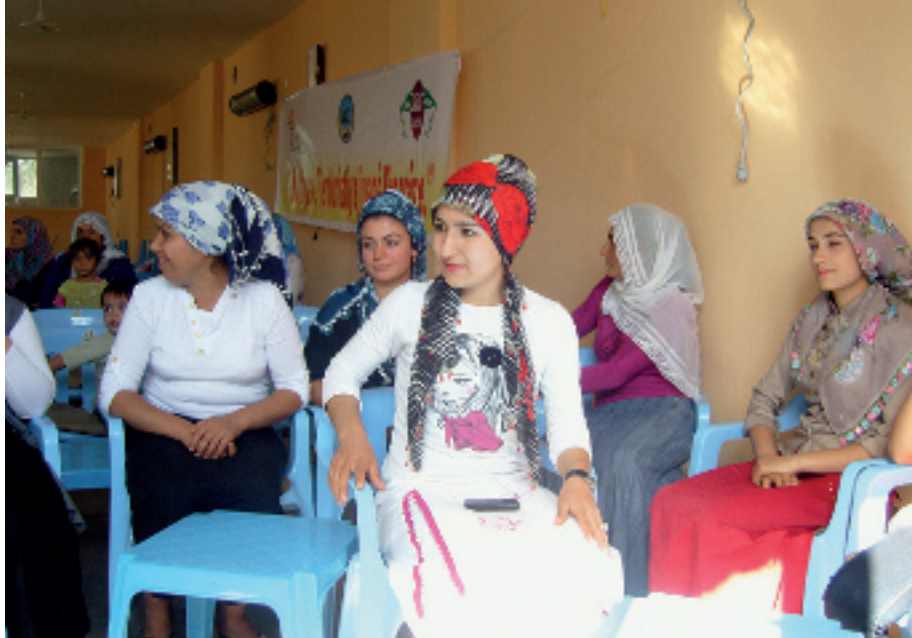
Seminarium på kommunhuset i Selis. Många kvinnor kom för att lyssna till en ung kvinnlig läkare som arbetar med familjeplanering, preventivmedelsrådgivning och barnafödande.