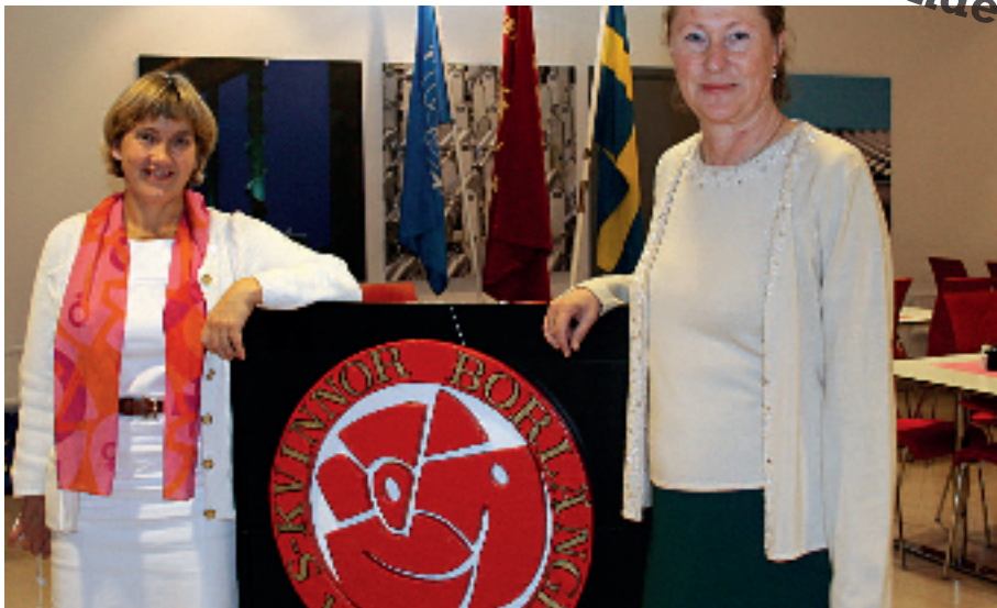
Stort grattis till S-kvinnor i Borlänge som i år firar 90-årsjubileum!