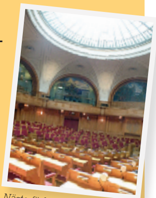
Nästa förbundsmöte hålls den 24-25 augusti 2013 i riksdagens andrakammarsal i Stockholm.

S-kvinnors förbundsexpedition Box 70458 107 26 Stockholm E-post: susanne.andersson@s-kvinnor.se